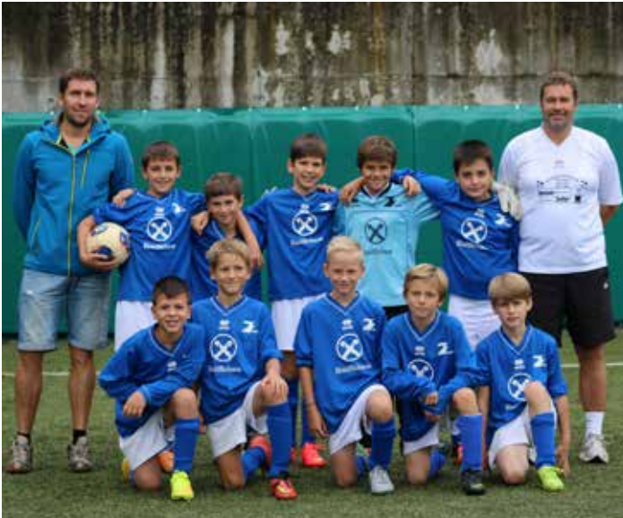
Die U-10 Blau belegte den respektablen sechsten Rang beim Arnold Plunger Turnier.